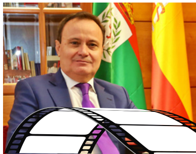
Ángel Viveros Gutiérrez Alcalde de Coslada